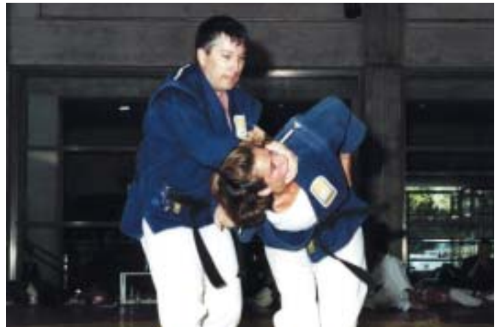
Conocer estas técnicas puede evitar situaciones de riesgo

El curso incluye la licencia federativa con seguro médico y de responsabilidad civil para todas las asistentes. El plazo de solicitudes terminará el 30 de julio .