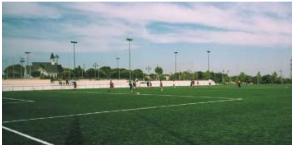
Imagen de uno de los campos de hierba artificial durante un entrenamiento

En memoria de Grosso, los campos de hierba artificial , dos en total, del Recinto Ferial y Deportivo llevarán siempre su nombre.