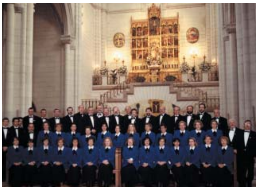
El Coro Villa de Las Rozas tras un concierto en la Iglesia de San Miguel

Por primera vez, se editará un CD con el repertorio del Festival. Una magnífica forma de promover el intercambio cultural y estimular la experiencia musical a través de uno de los “instrumentos” más extraordinarios: la voz humana . Los conciertos comenzarán a las 20.30 h.