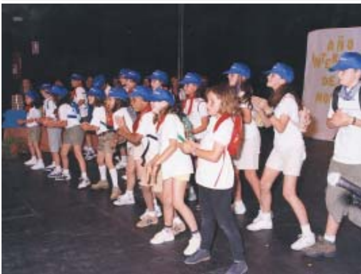
En la imagen, un momento de las actuaciones de los participantes

El pasado 7 de junio, tuvo lugar la ceremonia de entrega de los Premios del XVIII Concurso Literario Escolar Vicente Aleixandre. En esta Edición participaron 16 centros docentes del municipio.