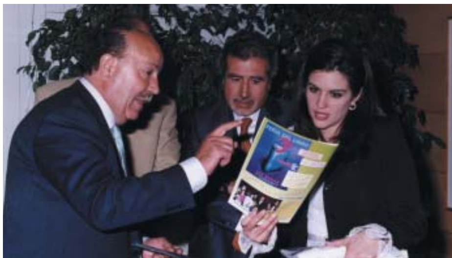
El Alcalde roceño enseñando un ejemplar del Boletín Municipal