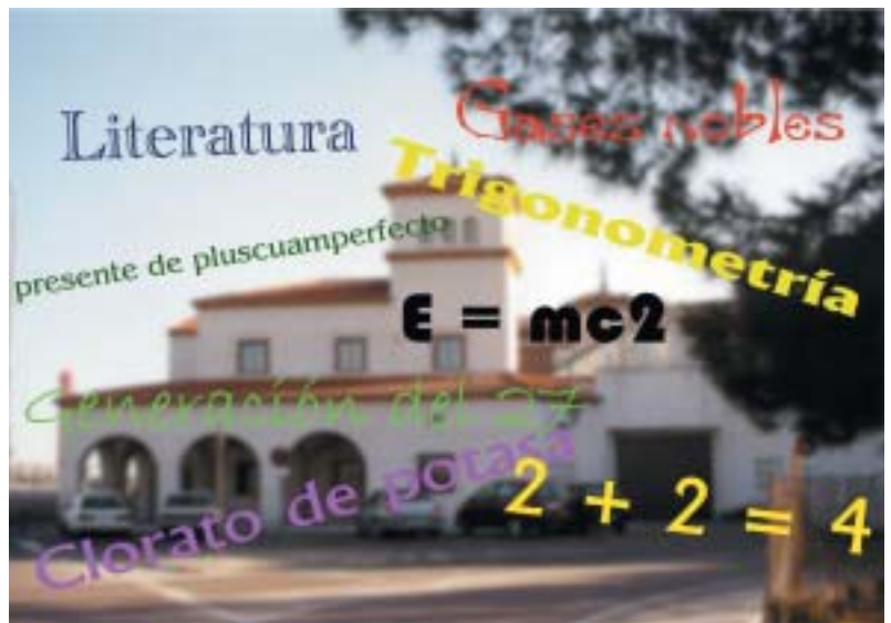
La Concejalía de Juventud será el escenario de estos cursos

Más información en la Concejalía de Juventud