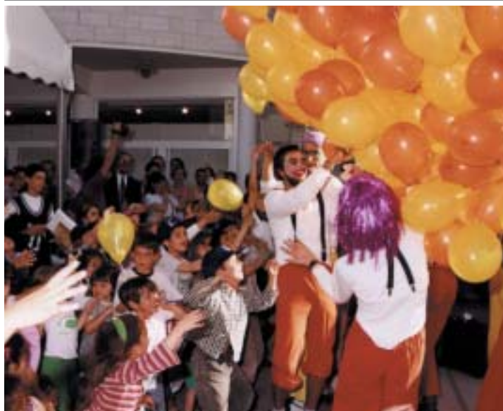
Promover la lectura en los más pequeños es formar lectores del futuro

La III Feria del Libro volvió a celebrarse en nuestro municipio, pero con nueva ubicación. De esa manera, del 24 de mayo al 2 de junio, la plaza del Centro Cultural se llenó de páginas repletas de historias, de globos, títeres y muchos lectores.