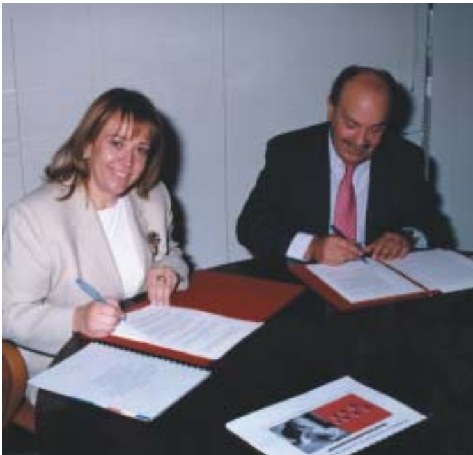
Momento de la firma del Protocolo de Adhesión al Programa de Creación de Plazas Residenciales y de Atención Diurna para Mayores Dependientes

Gracias a la cesión que el Ayuntamiento ha realizado a la Consejería de Servicios Sociales de la Comunidad de Madrid, de una parcela de 13.600 m 2 , en la zona de "El Montecillo", nuestro municipio contará con nuevos equipamientos para mayores .