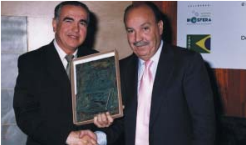
El Alcalde de Las Rozas hace entrega de una placa honorífica al Presidente de la Fundación Biosfera, colaboradora en las jornadas

Veinte representantes de distintos Ayuntamientos de la República del Brasil visitaron nuestro municipio con motivo de la celebración de unas Jornadas de Trabajo en las cuales se explicaban las líneas de gestión del Ayuntamiento roceño en áreas como el Deporte, la Cultura, el Medio Ambiente, el Urbanismo, la Gestión Económica, los Servicios Sociales y la Educación.