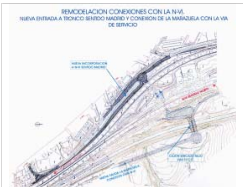
En la imagen, el plano del nuevo acceso desde la zona de Eurogar

Además, se procederá al corte de la entrada al casco por el viejo cuartel de la Guardia Civil y a la cesión por parte de Demarcación de Carreteras de Madrid del tramo de vía comprendido entre la nueva glorieta y la antigua entrada, pasando a ser considerado viario local , permitiendo su mejora estética.