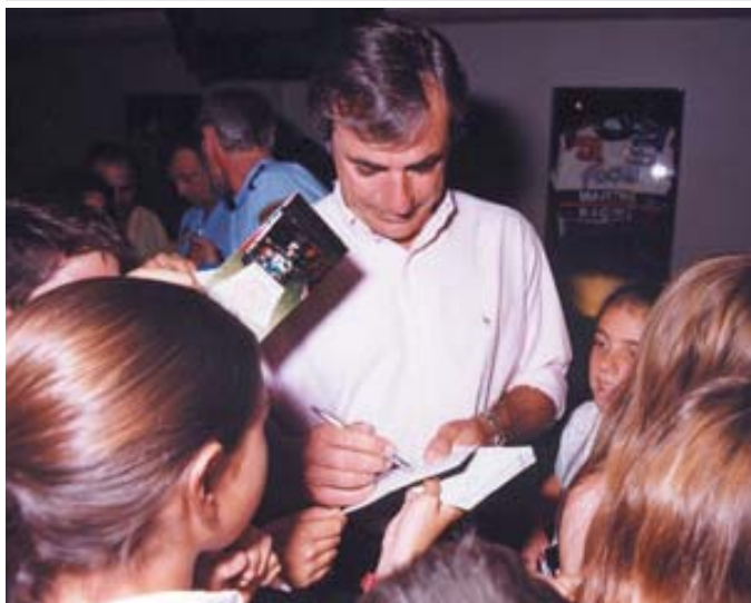
Los 65 finalistas hicieron de este Acto una animada fiesta

El Karting Indoor de Las Rozas volvió a servir de escenario, el pasado 19 de junio, para la entrega de los Premios del Curso de Educación Vial que año tras año imparten agentes de la Policía Local, destinado a alumnos de 4º de Primaria.