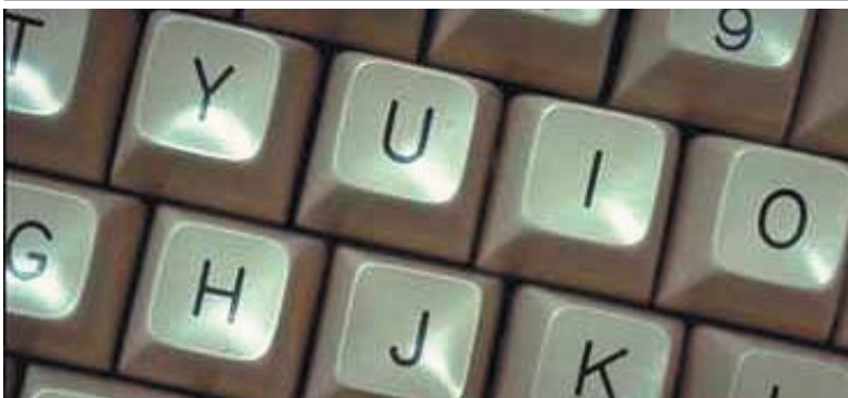
El programa Autocad es uno de los más prestigiosos en diseño industrial

Con este curso, la Concejalía de Juventud ofrece la posibilidad a los jóvenes roceños de introducirse en uno de los programas informáticos más utilizados en diseño industrial .